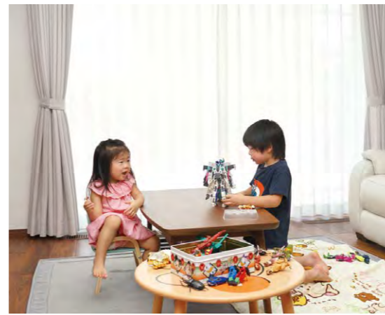
ロボット遊びや外遊びも仲良く一緒に!

マイホームの夢をかなえたご夫婦は想像以上のゆとりを実感しているといいます。それは家族の未来図が見えてきた安心感であり、それを支えてくれる味方を得たゆとりでした。