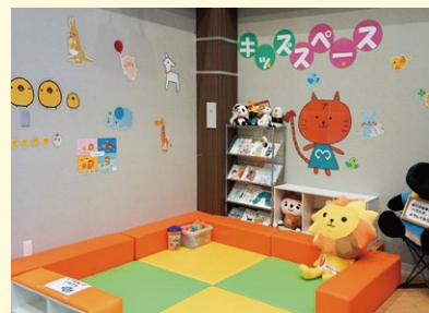
自慢のキッズスペースは社員作!

秋田店は(株)ミナミ保険の本社でもあり、総勢18名のスタッフが在籍しております。秋田駅東口に位置し、土日も営業している利便性から多くのお客さまにご来店いただいております。保険・住宅ローン部門が一致団結し、よりよいサービスの提供に日々努めております。今後も皆さまからの一層のご愛顧を賜りますようお願い申し上げます。