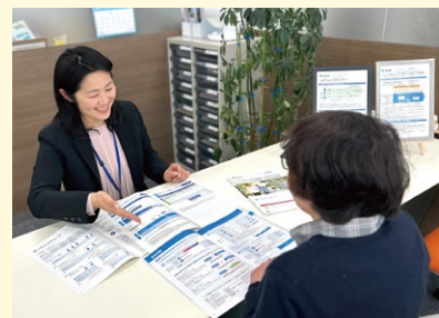
お客様のご要望に沿うプランを一緒に考えます

50周年という長い歴史の中の若い店舗ではありますが、ミナミ保険の良き伝統を受け継ぎ、新しい風となり、お客様に感謝し、喜んでいただける店作りを目指しております。『どうぞ気軽に遊びにきてたんせ!!!』