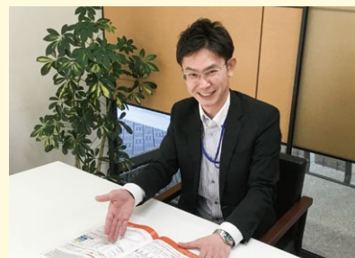
どうぞお気軽にご相談ください

お客様を守るご提案、お客様に寄り添い頼りにされるミナミ保険となるよう『For the お客様』の精神でお応えしてまいります。どうぞお気軽にご相談ください。